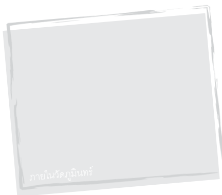
ภายในวัดภูมินทร์

❖ พิพิธภัณฑ์สถานแห่งชาติน่าน ตั้งอยู่ริมเส้นทาง 101 ก่อนเข้าตัวเมืองน่าน ภายในจัดแสดงโบราณวัตถุของชาวพื้นเมืองภาคเหนือ และชาวเขาเผ่าต่างๆ สิ่งสำคัญที่สุดคือ “งาช้างดำ” วัตถุมงคลคู่เมืองมีให้ชมเพียงแห่งเดียวในประเทศไทย