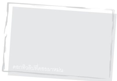
ดอกทิวลิปที่ดอยผาม่ม่น

❖ วัดพระธาตุผาเงา นมัสการหลวงพ่อดาเงา ไหว้องค์พระธาตุผาเงาที่สร้างขึ้นบน