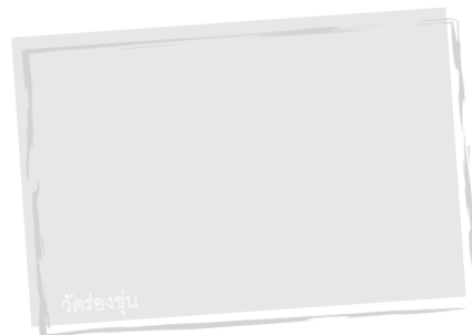
วัดร่องขุน

❖ ดอยผาม่ม่น ชมทิวลิปหลากสี แปลงไม้ดอกเมืองหนาว เช่น ดอกลิลลี่ ดอกหน้าวัว ที่ศูนย์ส่งเสริมเกษตรที่สูงดอยผาม่ม่น