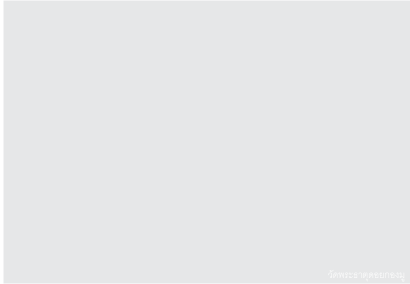
วัดพระธาตุคอกยงมู

เส้นทางคลาสสิก ดำเนินการเดิน ทางบนขุนเขาที่คดเคี้ยวยาวไกลนับพันโค้ง สู่เมืองในอ้อมกอดของขุนเขา ชายแดนของ ประเทศ