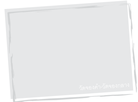
วัดจองคำ-วัดจองกลาง

❖ แม่ฮ่องสอน จังหวัดชายแดนเล็กๆ ที่น่ารัก มีที่เที่ยวนานาหลาย เช่น พระธาตุดอยกองมู วัดศีลปะพม่าหลายแห่ง ปางอุ๋ง