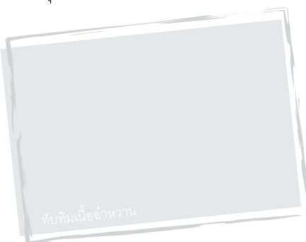
ทับทิมเนื้อจันทวน

❖ อุทยานแห่งชาติตากสินมหาราช แหล่งศึกษาธรรมชาติและชมนกนานาพันธุ์ เป็นจุดชมทิวเขาและผืนป่าที่สวยงาม มี