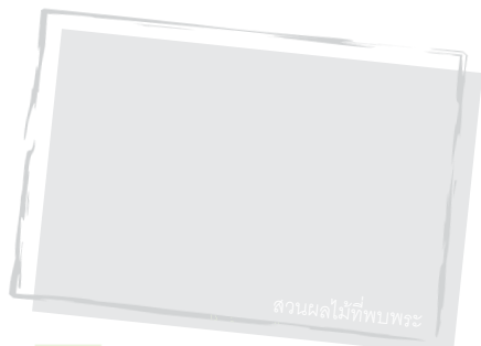
สวนผลไม้ที่พบพระ

❖ บ่อน้ำร้อนแม่กาษา น้ำที่นี่มีอุณหภูมิไม่สูงมากนัก มีธรรนำร้อนและน้ำเย็นมาบรรจบกัน สามารถเล่นได้