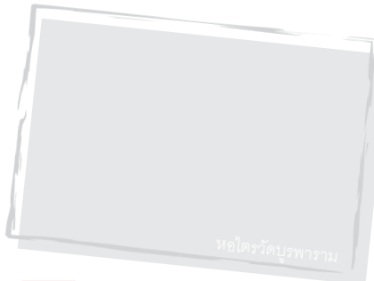
หอไตรวัดบูรพาาราม