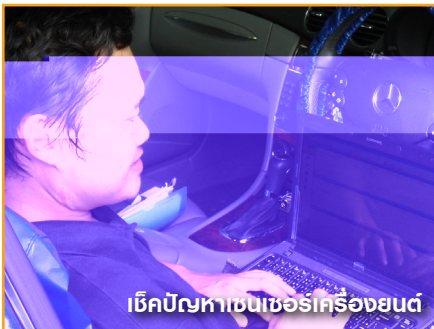
เช็คปัญหาเซนเซอร์เครื่องยนต์