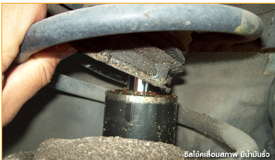
ซิลิโคนเสื่อมสภาพ มีน้ำมันรั่ว

คุณควรจะตรวจสอบพรมทุกพื้นว่ามีจุดใดชื้นหรือไม่ ซึ่งอาจจะมาจากจุดรั่วตามขอบประตู หรือขอบยางกระจกหน้าเสื่อมก็เป็นสาเหตุของน้ำรั่วเช่นเดียวกันครับ