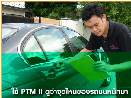
ใช้ PTM II ดูว่าจุดไหนของรถชนหนักมา

เมื่อคุณได้ตรวจรถตามที่คู่มือแนะนำ คุณก็ควรจะพร้อมแล้วที่จะจ่ายค่ามัดจำและมองหาที่จัดไฟแนนซ์ที่ให้ออวดจัดที่สูง หรือ ดอกเบี้ยต่ำ และผ่อนได้ยาว