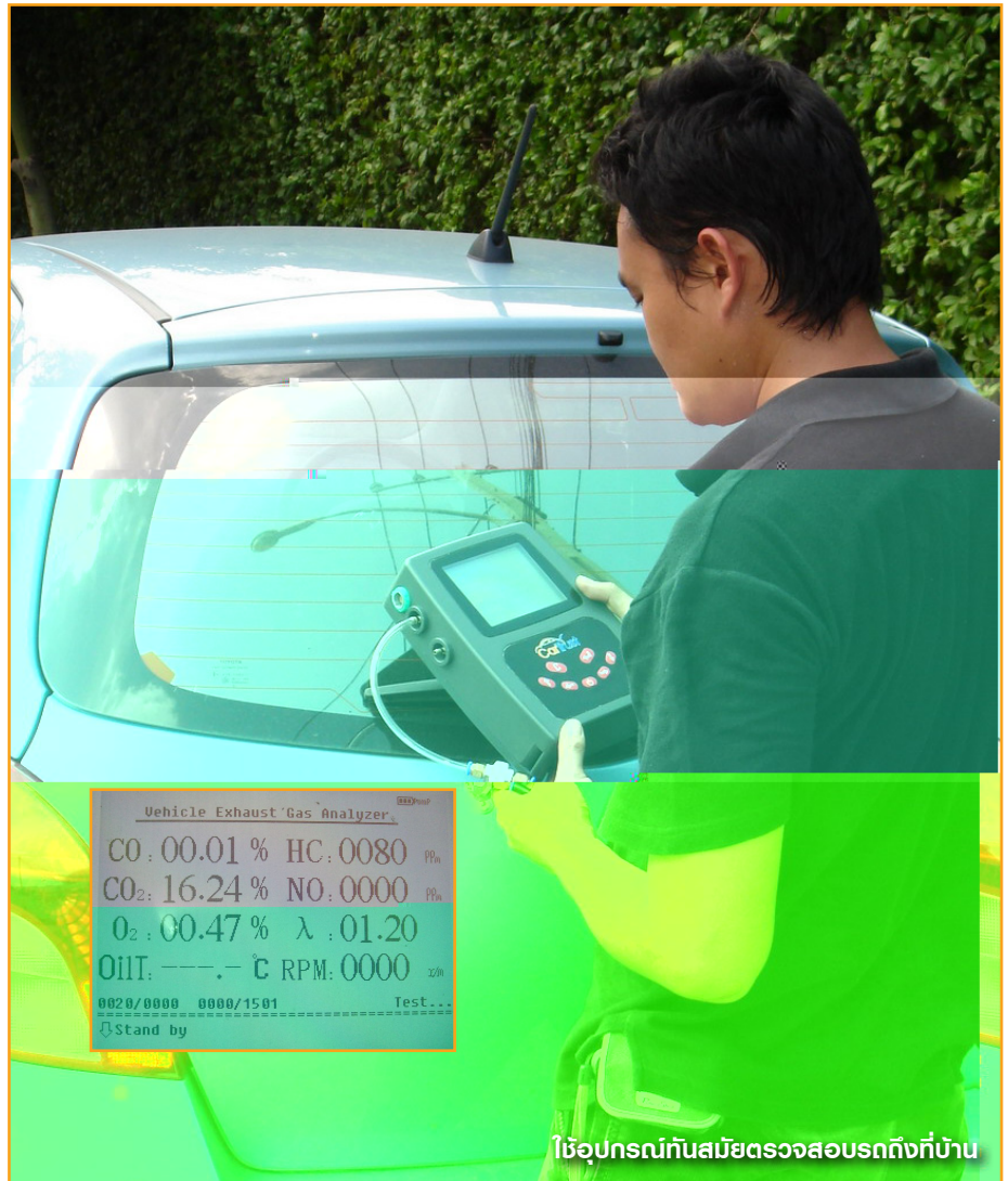
ใช้อุปกรณ์ทันสมัยตรวจสอบรถถึงที่บ้าน

นอกจากนั้น CarTrust ยังมีบริการ CarTrust Easy ที่จะช่วยให้คุณหาแหล่ง