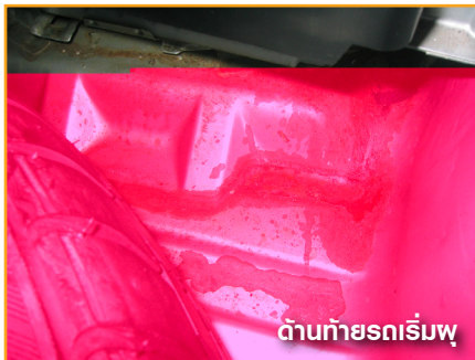
ด้านท้ายรถเริ่มพุด

สอบถามคร่าวๆ กับผู้ขายว่ามีการชนมาหนักมากน้อยแค่ไหน เป็นเรื่องปกติการรถที่มีอายุจะผ่านการซ่อมเครื่อง หรือซ่อมสีมาบ้าง แต่ถ้าซ่อมโดยผู้ที่ไม่ได้มาตรฐาน รถคันนั้นๆ ก็จะขับไม่เหมือนเดิม หรืออายุรถก็กล่น้อยกว่ารถที่ถูกซ่อมอย่างเอาใจใส่