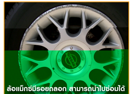
ล้อแม็กซ์มีรอยถลอก สามารถนำไปซ่อมได้

ให้ตรวจดูว่าล้อกระทะหรือแมกซ์ทั้งสี่ ลายเดียวกันหรือไม่ มีรอยเสียหายมากนักแค่ไหน ถ้าไม่มากก็ซ่อมได้ไม่เกินล้อละ 800 บาท ต่อมาก็มาดูยางกันครับ ตามปกติแล้วยางรถอยู่ได้นานกว่า 2 ปี 50,000 กิโลเมตรร้านยางบอกคุณนะครับ เพียงแต่เราต้องดูให้แน่ใจว่ายังมีดอกยางเหลืออยู่พอสมควร แต่ถ้าทดลองขับแล้วรู้สึกยางแข็งไปก็อย่าลืมตั้งบไว้แล้วกันนะครับ