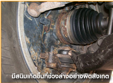
มีสนิมเกิดขึ้นที่ช่วงล่างอย่างผิดปกติ