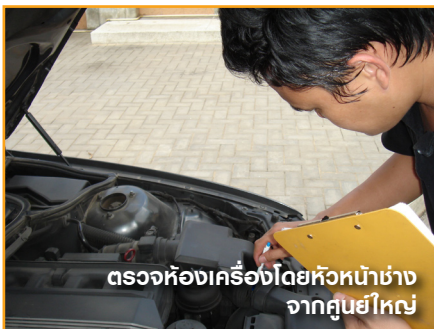
ตรวจห้องเครื่องโดยหัวหน้าช่าง จากศูนย์ใหญ่

CarTrust เป็นบริษัทที่มีบริการ one stop service (OSS) ที่จะมาช่วยคนที่ซื้อรถมือสอง เรามีบริการ CarTrust Check ที่จะช่วยคุณตรวจสอบสภาพรถ และทำรายงานอย่างเป็นทางการโดยช่างที่มีประสบการณ์จากศูนย์ใหญ่ด้วยอุปกรณ์นำเข้ที่ทันสมัยที่จะช่วยคุณลดความเสี่ยงเช่นไฟเตือนที่ไม่หายแปลว่าเซนเซอร์ หรืออะไหล่ที่เสีย ราคาเปลี่ยนเท่าไร่ หรือรถถูกชนหนักและคว่ำมาก่อน เป็นต้น