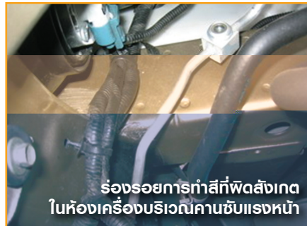
ร่องรอยการกำลังที่ผิดปกติในห้องเครื่องบริเวณคานขับเคลื่อนหน้า