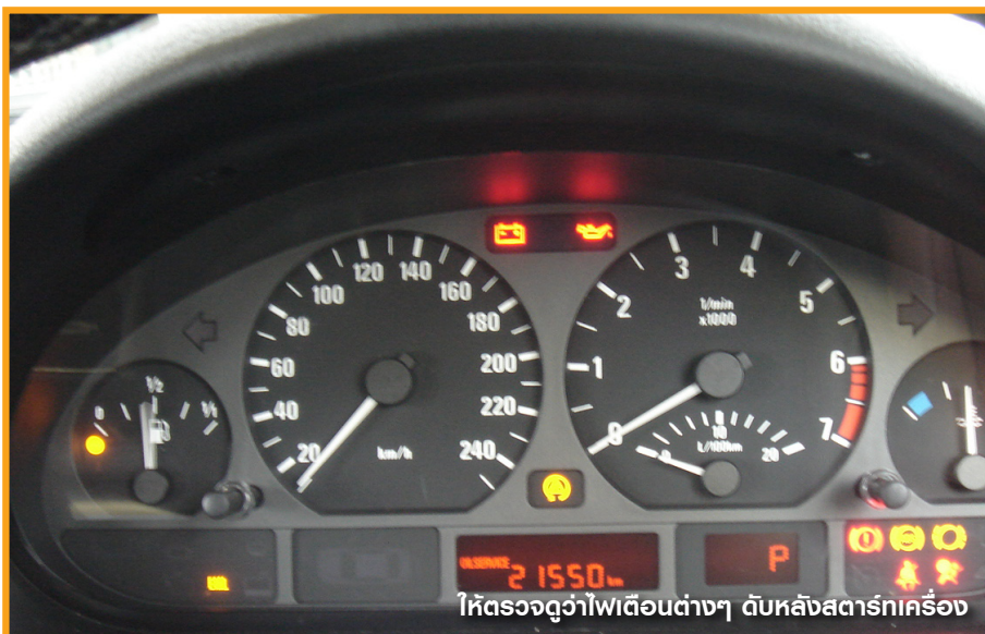
ให้ตรวจดูว่าไฟเตือนต่างๆ ดับหลังสตาร์ทเครื่อง

สุดท้ายก็อย่าลืมตรวจเอกสารก่อนมัดจำเงินก่อนนะครับ ว่ารถจดปีไหน รถพลิตปีไหน มีเจ้าของมากี่คน เป็นรถบ้านหรือรถบริษัท สังกัดตรงกับที่เราเห็นหรือไม่ เข้าเช็คศูนย์ทุกครั้งรีปเล่า เป็นต้น