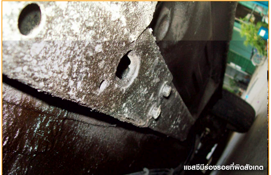
แชสซีมีร่องรอยที่พิดสังเกต

ให้ตรวจทุกๆ จุด เพื่อหาร่องรอยพิสดังเกตที่อาจเป็นสาเหตุให้เกิดการเป็นสนิมอย่างช้าๆ โดยดูช่วงล่าง ชุมล้อ ถ้าตามตัวรถมีจุดโป่งพอง แสดงว่าสนิมได้กัดตัวภายใต้ชั้นสีแล้ว